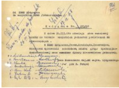
Plany operacyjnego zabezpieczenia miasta Bydgoszczy