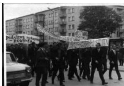
1 maja 1968