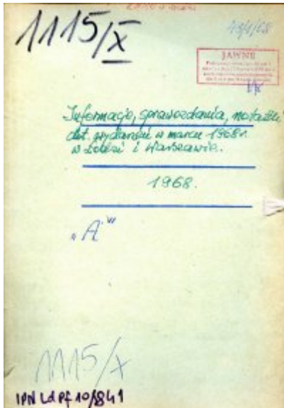
Informacje, sprawozdania, notatki dot. wydarzeń w marcu 1968 r. w Łodzi (wybrane dokumenty), IPN Ld PF 10/841.