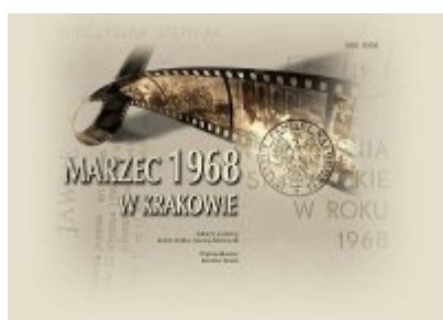
Marzec 1968 w Krakowie