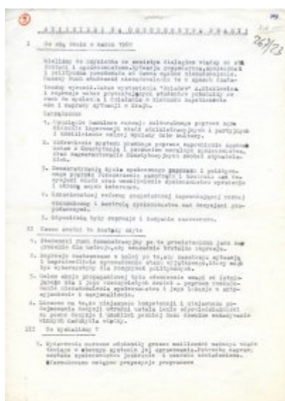
Fotokopie ulotek autorstwa studentów Krakowa oraz maszynopisy odezwo i apeli pochodzące z akt śledczych