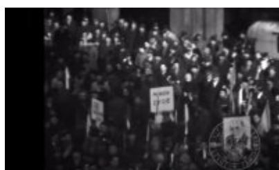
Kraków, manifestacja na Ryнку Głównym