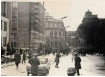
Wydarzenia marcowe Uniwersytet Warszawski - Krakowskie Przedmieście (zdjęcia SB). Sygnatura tematu w systemie ZEUS: IPNBU-3-19-1.