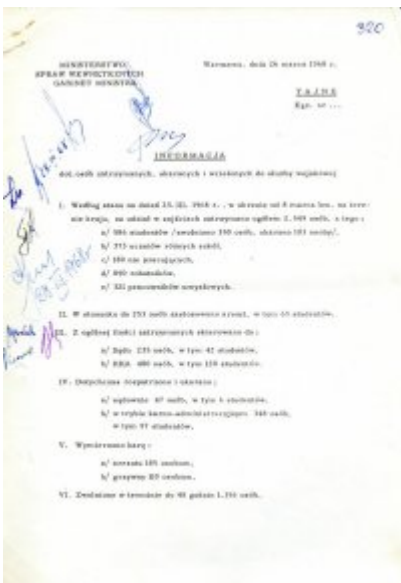
Informacje Gabinetu Ministra Spraw Wewnętrznych dotyczące statystyki odnośnie osób zatrzymanych, ukaranych i wcielonych do służby wojskowej oraz objętych postępowaniami karnymi w związku z wydarzeniami marcowymi 1968 r.