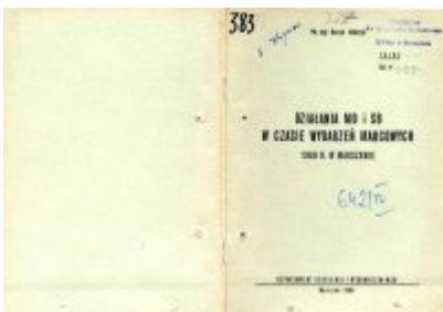
Wydawnictwo szkoleniowe MSW dotyczące wydarzeń Marcowych 1968 r. ("Działania MO i SB w czasie wydarzeń marcowych 1968 r. w Warszawie")