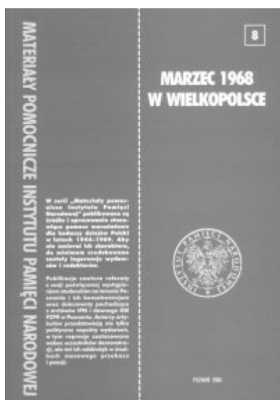
Marzec 1968 w Wielkopolsce - materiały pomocnicze IPN