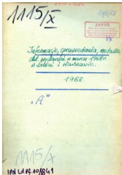
Informacje, sprawozdania, notatki dot. wydarzeń w marcu 1968 r. w Łodzi (wybrane dokumenty), IPN Ld PF 10/841.