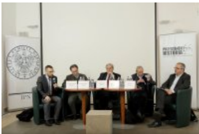
IPNtv: Rok 1968 z perspektywy półwiecza - panel dyskusyjny